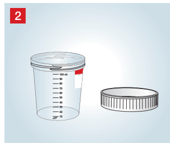
2 Deckel aufschrauben und mit der flachen Seite nach unten ablegen.