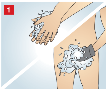
1 Hände und äußere Genitalien reinigen und trocknen.